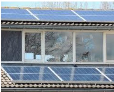
Schuine daken toepassing

dus inclusief extra groep in meterkast, aardlekschakelaar , installatie, steunen verbindingskabels kabel naar meterkast ( montage over muur maximal 25 meter ) e.d.