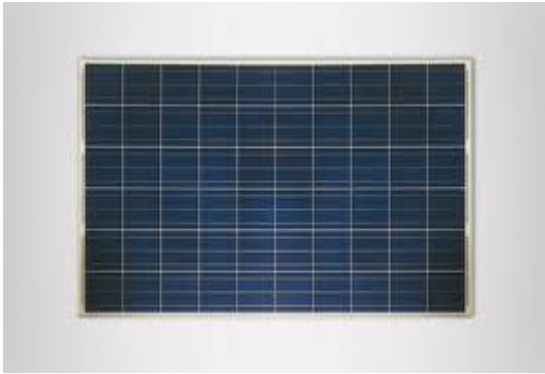
BYD paneel 240 Wp