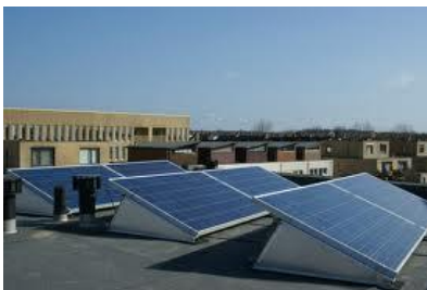
Platte daken toepassing

Meerprijs voor montage op platte daken i.v.m. aluminium steunen en benodigde bevestigingsmateriaal ( troitoir bandjes ) voor montage van de steunen.